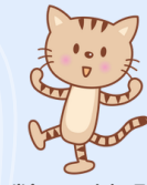
当会マスコットキャラクター 元気ちゃん

オンラインセミナーは 気兼ねなくマイペースに 学習できるよ！ 繰り返し視聴して 理解度が高まります！